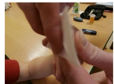
9. tuto první kapku krve otřeme buničitým čtvercem