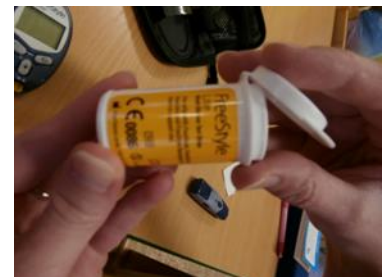
3. zásobník na proužky na měření glykémie