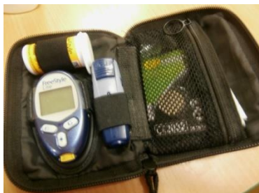
1. pouzdro s glukometrem