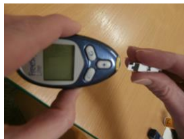
5. proužek zasuneme částěčně do glukometru