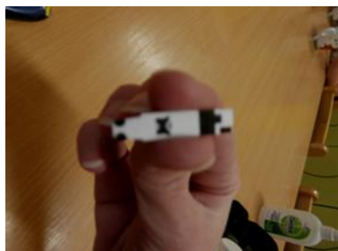
4. proužek na měření glykémie