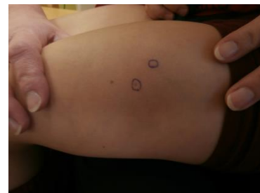
8. Označená místa aplikace inzulinu