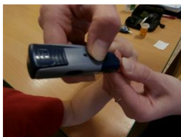
7. lancetou pícheme do prstu