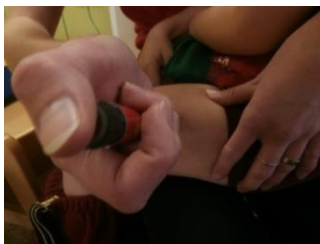
6. aplikujeme inzulín