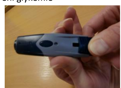
6. natáhneme lancetu na odběr krve